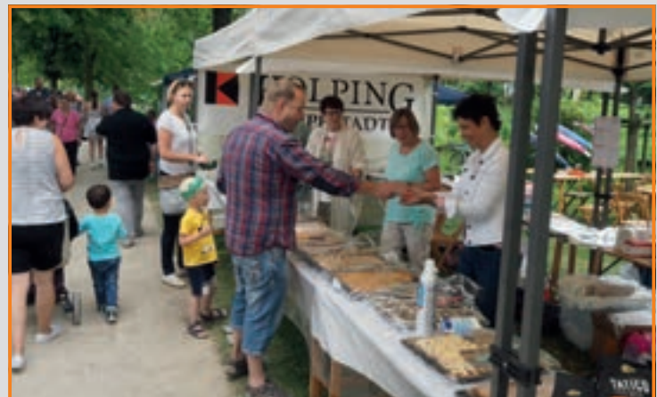
Parkzauber 2018 im Grünen Winkel