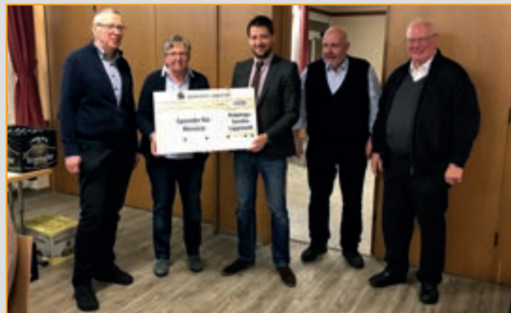
Jahresanfang 2018, Scheckübergabe für Erdbebenopfer in Mexiko

Mittwoch, 23. Januar 2019, Frauenstammtisch 18:00 Uhr: Treffen, Ort wird noch bekannt gegeben