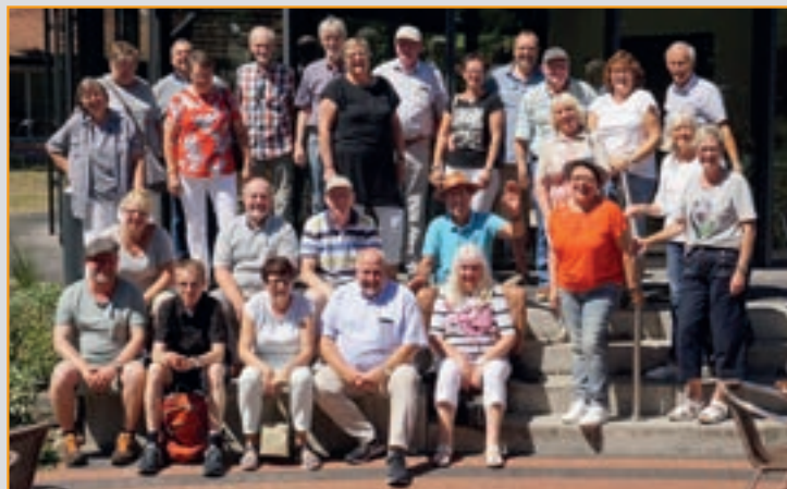
Wochenendfahrt 2018 nach Salzbergen

18:00 Uhr: Treffen, Ort wird noch bekannt gegeben