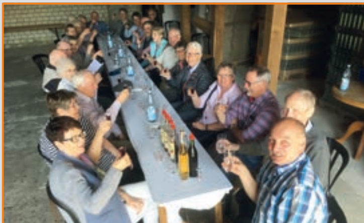
Besichtigung der Brennerei Horstmann in Sendenhorst mit Verkostung