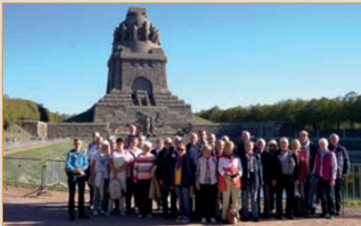
Fahrt nach Leipzig vom 29.09. bis 03.10.2018 . . .

Mittwoch, 16. Oktober 2019, Frauenstammtisch 18:00 Uhr: Treffen, Ort wird noch bekannt gegeben