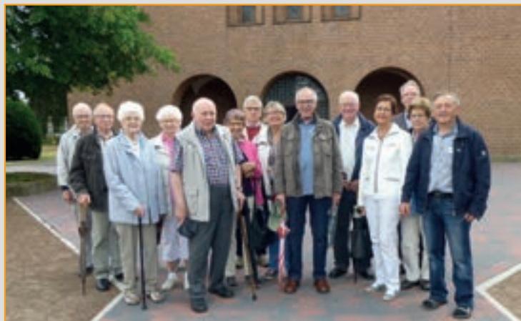
Seniorenfahrt 2018 nach Salzbergen