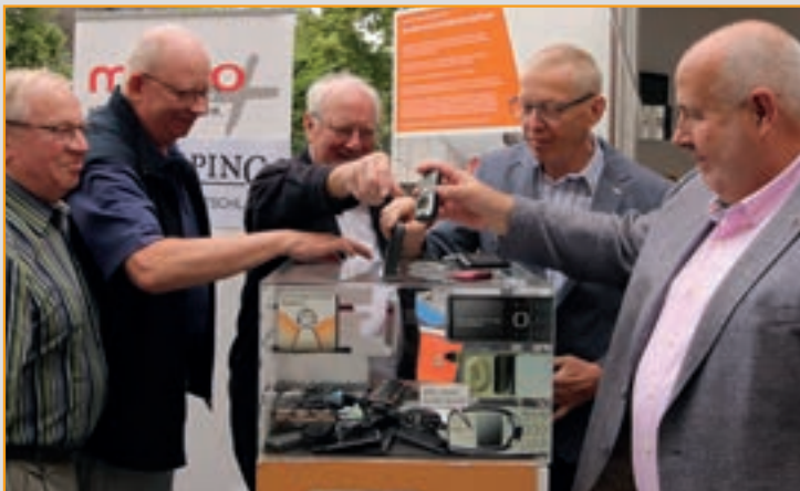
Kolping und missio unterstützen die Handysammelaktion - Ostendorfschulhof

www.kolpinglippstadt.de , im Schaukasten am Kolpinghaus oder der Tageszeitung