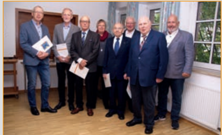
166. Stiftungsfest 2018 mit Jubilarehrung

13:45 Uhr: Abfahrt ab Kolpinghaus mit dem PKW Anmeldung: Bei Waltraud Grebe bis 01. September, Tel. 1 08 48