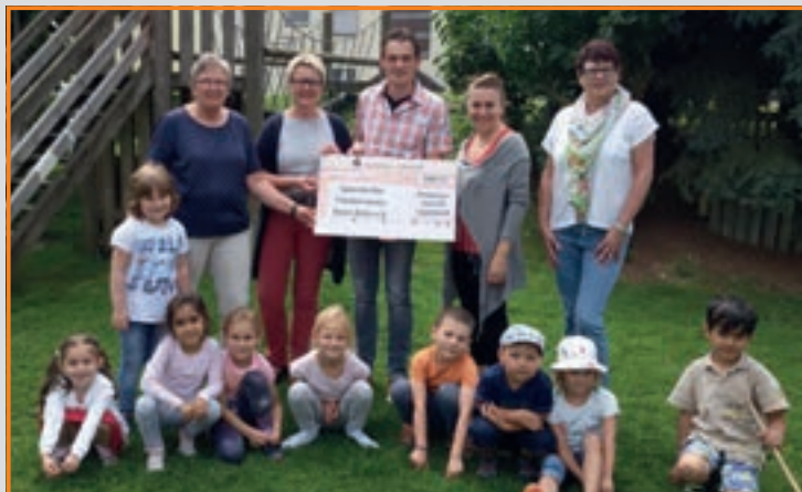
Der Erlös vom "Lippstädter Lenz" ging an den Förderverein Boni-Kids