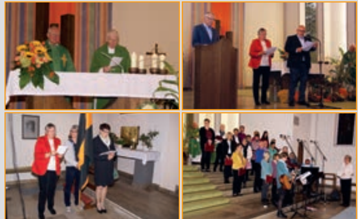
165. Stiftungsfest 2017, Festgottesdienst in der St. Elisabeth-Kirche

Dienstag, 04. September 2018, Baumführung in Sünninghausen auf dem Biohof Feldmann. Anmeldung bis 01. September bei Waltraud Grebe, Tel. 1 08 48