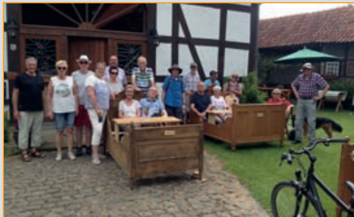
Fahrradtour zum Bettencafé auf Hof Keinemann in Meckingsen

Juni 2018 Stadtführung in Soest Näheres wird noch bekannt gegeben