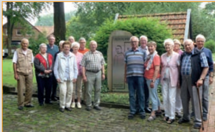
Seniorenfahrt 2017 nach Salzbergen