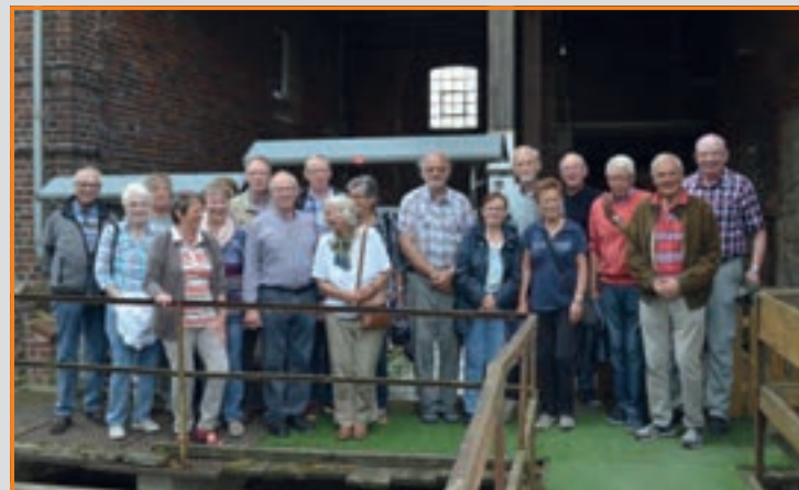
Besichtigung der Wassermühle Schäfermeier in Verne

Anmeldung: Bis 26. April, bei Waltraud Grebe, Tel. 1 08 48