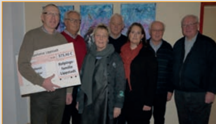
Der Erlös durch den Kuchenverkauf auf den Rathausplatz, anlässlich der Eröffnung der Fahrradroute „Historische Stadtkerne“ ging an den SKM.

Leiter der Senioren: Klosterstraße 28 · 59555 Lippstadt Franz-Josef Salmen Telefon: 0 29 41 / 5 80 49 franz.josef.salmen@gmx.de