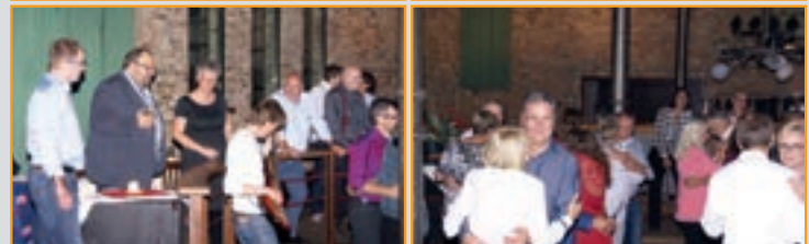
165. Stiftungsfest 2017, Tanz mit der Show- und Eventband Seven Beats bis um 3