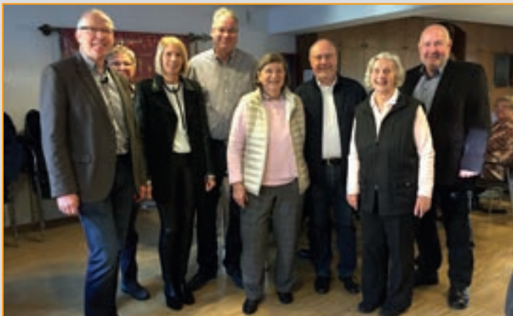
Kolping-Gedenktag 2016 mit 8 Neuaufnahmen