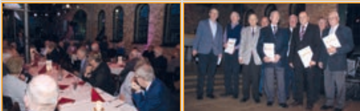
165. Stiftungsfest 2017, Feier in Cosacks Brennerei mit Jubilarehrung