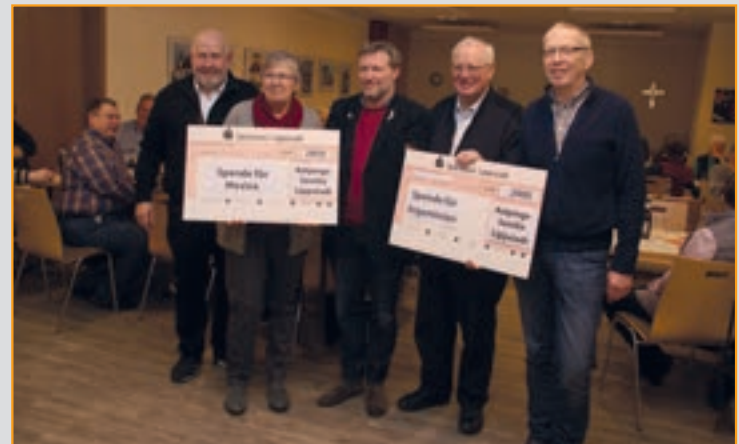
Jahresanfang 2017, Scheckübergabe für Mexiko und Argentinien