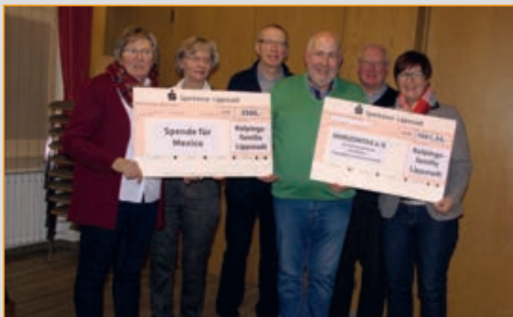
Jahresanfang 2016, Scheckübergabe für Mexiko und Horizontas