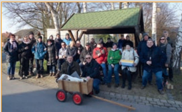
Boßeln 2016: Ein lustiger, sportlicher und geselliger Nachmittag