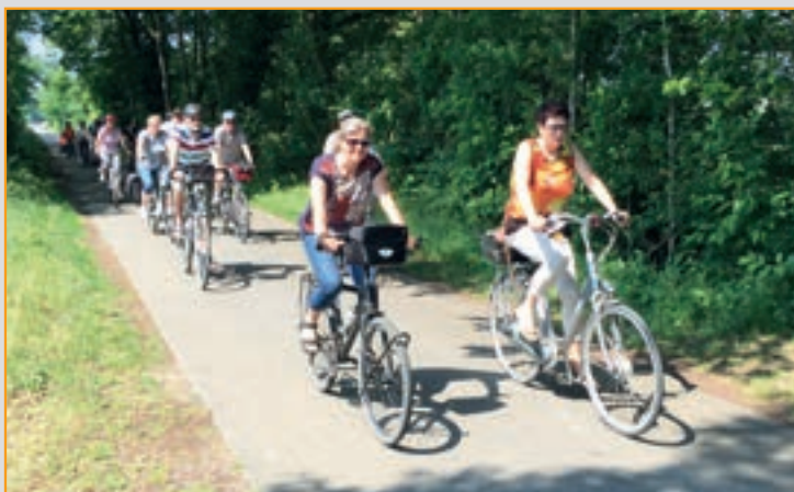
Fahrradtour 2016 mit Einkehr im Bauerncafe Rohlings Deelee in Delbrück