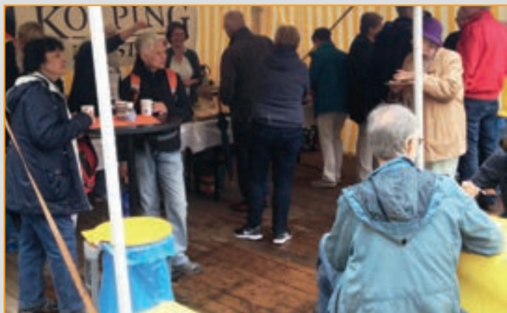
Bei der Eröffnung „Radtour Historische Stadtkerne“ auf dem Rathausplatz

Der Erlös ist für die Kolpingprojekte in Mexiko bestimmt