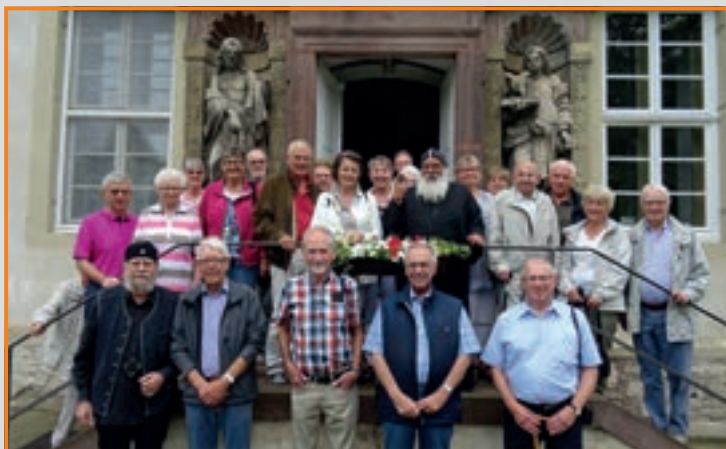
Tagesfahrt zum Koptenkloster in Höxter-Brenkhausen

14:00 Uhr: Abfahrt ab Kolpinghaus mit PKW