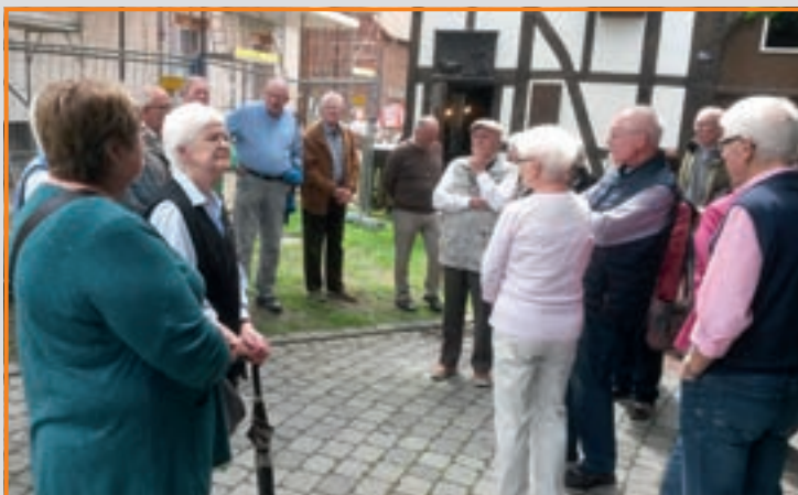
Fahrradtour zum Heimathaus Mastholte