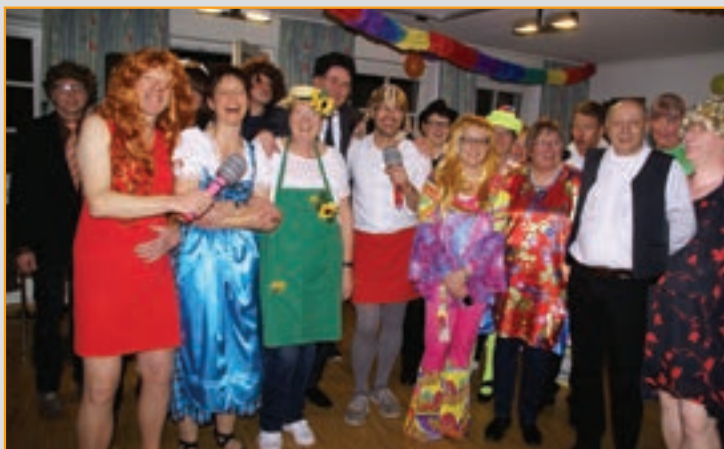
Karneval 2016 mit allen Hauptdarstellern