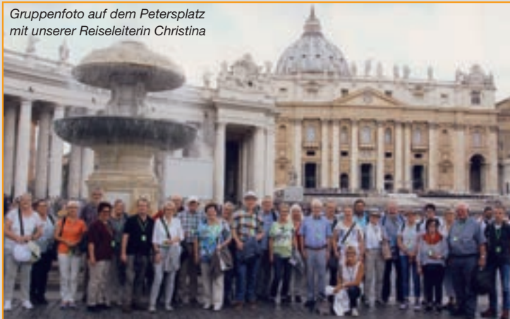
Flugreise nach Rom und Assisi vom 1. - 7. Oktober